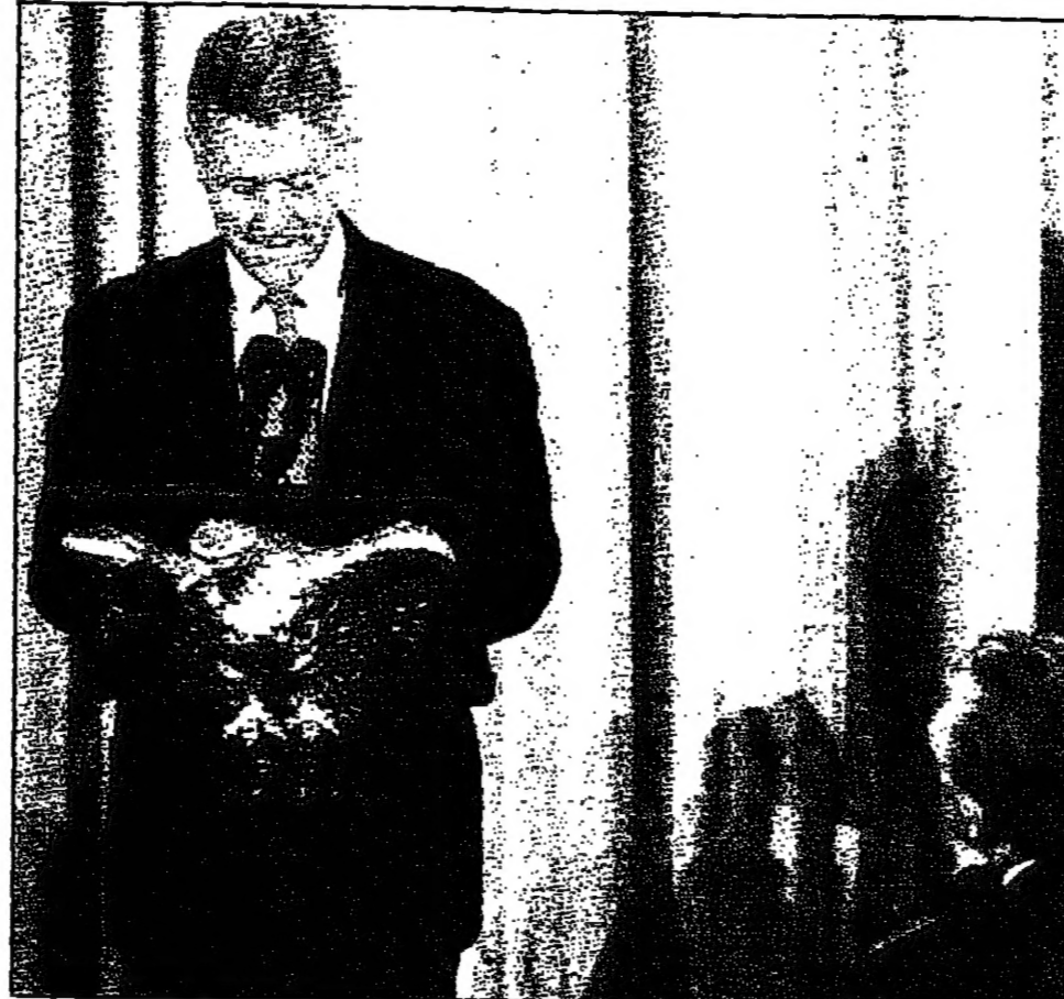
الرئيس الأمريكي بيل كلينتون يلقى خطابا الجمعة في البيت الأبيض أثناء لقائه مسؤولين ديمقراطيين